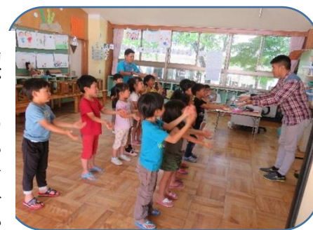
カピレ先生と英語の歌を楽しむ年長さん