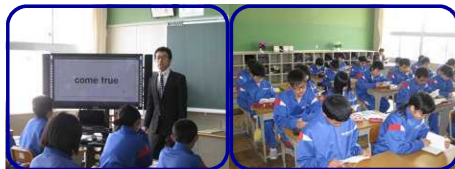
大型モニターを利用した授業