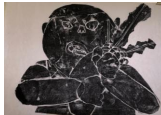
『だいこんとったぞ』