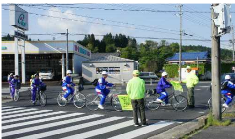
【自転車通学の様子】

平成25年度から本校では、距離によって規定していた自転車通学から「届け出制による自転車通学」に変更をしました。変更の理由は、生徒の体力向上のためであり、当時の校長が保護者に向けて次のよう