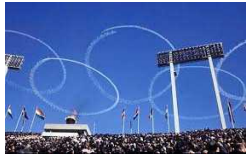
【東京オリンピック開会式青空の五輪】

1964年(昭和39年)の10月10日から東京オリンピックが行われました。私は当時1才であり、記憶は全くありませんが、この年の12月に妹が生まれたので、私が幼い頃は、妹の誕生と関わらせて東京オリンピックのことが、家族の話題になっていたことを記憶しています。東京オリンピックの開会式が10月10日に行われ、青空の中、ブルーインパルスが5色の五輪を描く演出は、当時、とても画期的であり、そのすごさは当時を知らない私たちでも映像から理解ができます。10月10日は、気象の観測史上、晴れる確率が高い特異日とされており、現在でも特異日は続いています。この東京オリンピック開会式の日を機に、10月10日が「国民がスポーツに親しみ、健康な心身を培う日」として、国民の祝日に制定されました。現在は