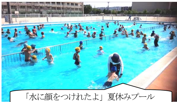
「水に顔をつけたよ」夏休みプール

この夏もまた、「高校野球選手権大会」などで活躍する選手から多くの感動をもらいました。点差がついていても最後まであきらめないプレー、粘って逆転の勝利など印象的でした。なぜ、こんなに感動するのでしょうか。それは、この選手達は、自分のめざす目標を強くもち、仲間と力を合わせて、結果が出るまでは決して手を抜かず、あきらめ