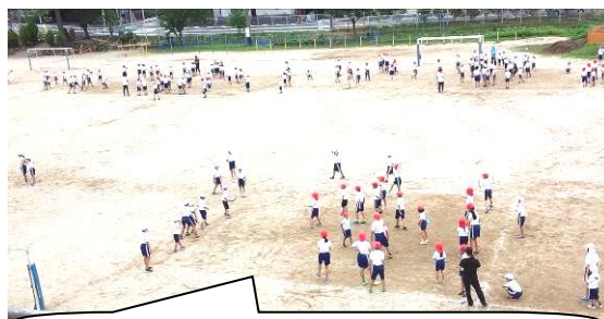
全校で「なかよし遊び」ドッチビー

保護者の皆様には、目標をもって努力するお子さんへの励まし、応援をお願い致します。