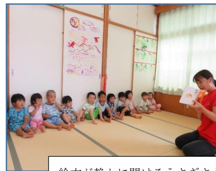
絵本が静かに聞けるうさぎさんだよ