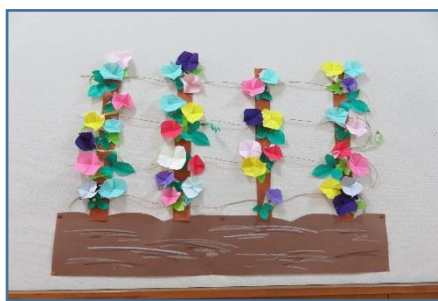
年中さんが作ったアサガオの飾り