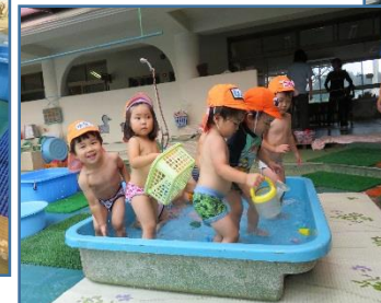
2才児 うさぎ組さん