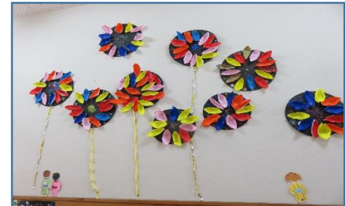
年長さんの作った花火の壁面飾り