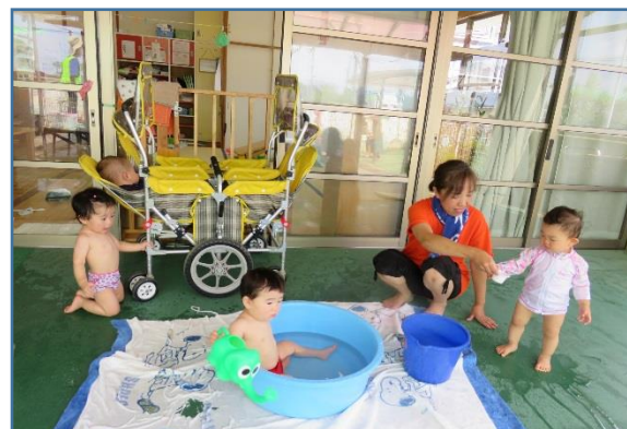
0才児いちご組さんは、お部屋の前で水遊び。ベビーカーでお昼寝中の子もいるねえ！