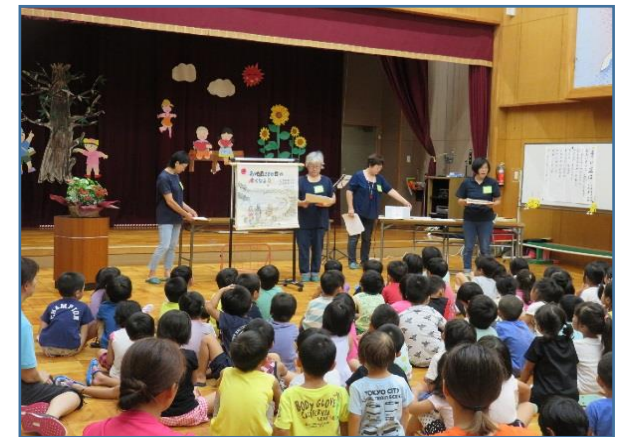
ほっとしよくらぶのみなさんの話に 静かに耳を傾げるこども達。