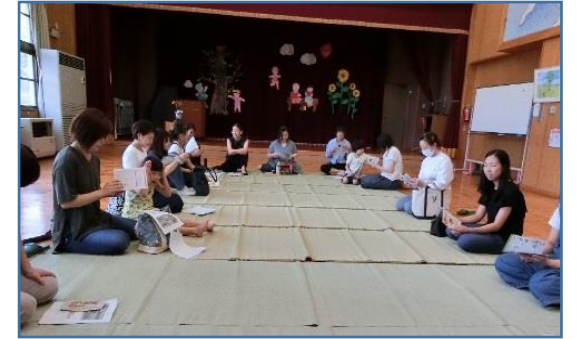
8月8日に行われた未満児組懇談会 みなさん、ご苦労様でした。

ぼたには、ススキが穂を開き、赤とんぼが行き交うこの頃、夜半にはこおろぎの鳴く声も聞こえてくるというのに、日中は、真夏のような暑さが続き、冷房全開の保育室です。先日9月9日(月曜日)は3回目の草取り交流会。「これ程暑いから、きっとおじいちゃんおばあちゃんには来てもらえないね」と職員で話していたのですが、朝から陽が照り真夏日になったにも関わらずに13名の方が参加して下さいました。まずは感謝！この日は、年中組のこども達のそばで滑り台の周りを30分間、草を取って頂きました。それは暑くて、こども達も「あつい あつい」と言いながら、それぞれの場所で各年次ともよく頑張りました。その後、お願いしてあった苗木のボランティアサークル「ほっとしよクラブ」の4名の方に、「わんぱく団の走れ一番星」「おじぞうさんの目が赤くなる日」「ちいちゃんのかげおくり」の大型絵本や手作りの紙芝居を読み聞かせて貰いました。ちょっと難しいからと、年少さんはすぐに出ていける様な場所に座ったのだけれど、とても静かに最後まで参加できた事に驚きました。小さいこども達でも、真剣に向き合えば、こんなに気持ちを動かしながら聞けるんだと改めて、思った時間でした。「あおいそらは」のフルートの演奏は、とても素敵で、ひとしお静かに聞き入ったこども達でしたよ。命の大切さ、重み、津波や戦争の怖さを、絵本や紙芝居を通して知ったこども達、このかわいいこども達の空の上は、いつも晴れて明るい日々が続きます様にと祈りたいです。草取り交流会に来て下さった方11名が、一緒に参加して頂けてよかったです。年長さんは、9月20日に、保護者の方にも参加して頂き、前田動物病院の先生に来て頂き「命の授業」を受けます。こどもには、気持ちや心に残る話が成長の栄養剤になっていきます。沢山の方にお世話になりいろんな影響を受けながら大きくなっていく事が大事ですね。まだまだ残暑厳しいですが、みなさん頑張りましょう。