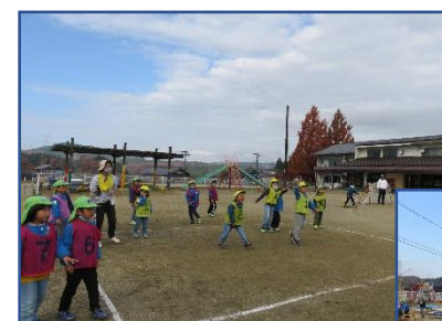
年長さん、今ドッチボールがおもしろい！