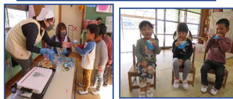
年少さん、畑で育てたニンジンでホットケーキを作ってもらいバクバク。