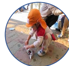
未満児さんも焼き芋会と一緒に参加！うさぎさんも洗って包んだよ

いちごひよこ組の子は、焼く前のお芋を持たせてもらって大喜び、所が、手放したくなくて大泣きだったね