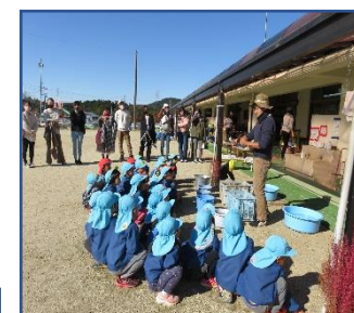
年中さん、焼き芋の話をよく聞いて・・・