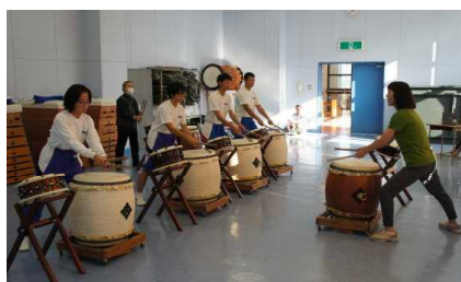
地域総合における太鼓指導

さて、岐阜県では、県の教育の方向性を示し、今後推進すべき具体的施策を明らかにした計画である『第3次岐阜県教育ビジョン』が2019年3月に発表されました。『第3次岐阜県教育ビジョン』とは、「世界的な視野をもち、『清流の国ぎふ』の未来を担う人材の育成」を基本理念とする、岐阜県の教育、学術、文化及びスポーツの振興に関する大綱のアクションプランとして、今後推進すべき具体的施策を明らかにした計画です。